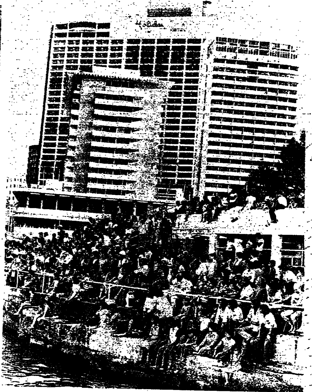
قسم من الجماهير الفيرة التي حضرت المهرجان

الافتتاح بوضع يختلف عن الاول . قسمت مسابقة التزلج الى قسمين اشترك في كل منها متنافسين . وقد استمرت المحاولات الثلاث التي قسم بها كل متسابق عن تسجيل المسافات الآتية :